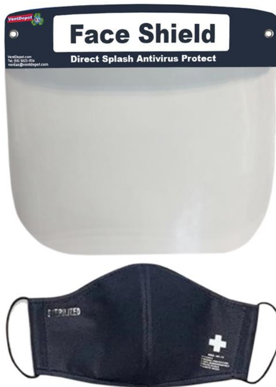
Características Técnicas Específicas de la Careta Protectora, MaskPlash.

El MaskPlash, cuenta con 2 meses de garantía sujeto a cláusulas de VentDepot.